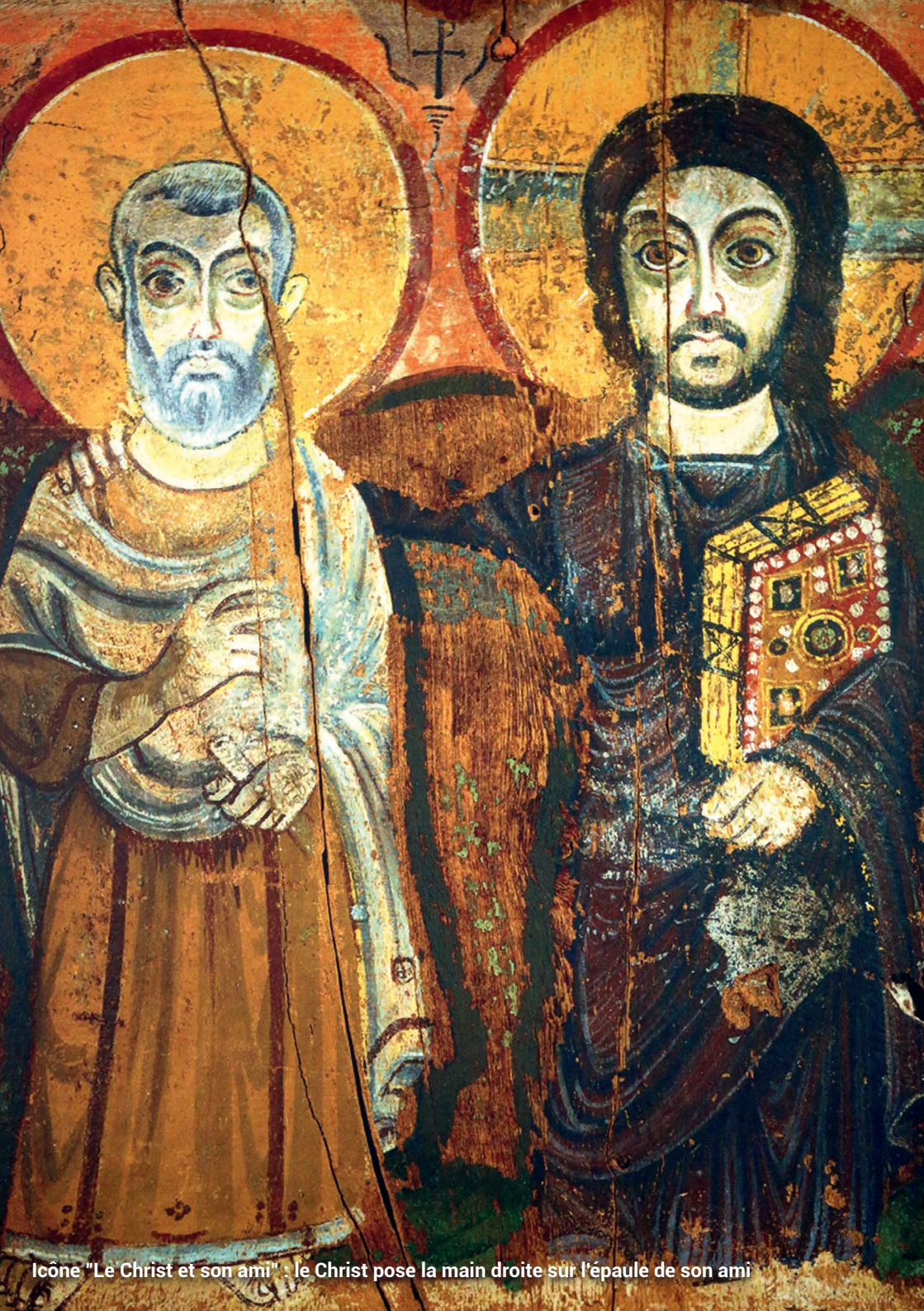
Icône "Le Christ et son ami" : le Christ pose la main droite sur l'épaule de son ami