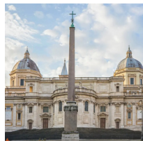
Basilique Sainte-Marie- Majeur