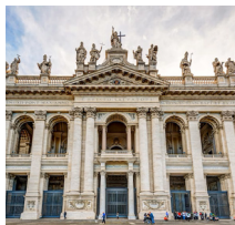
Basilique Saint-Jean- de-Latran