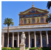
Basilique Saint-Paul- Hors-les-Murs