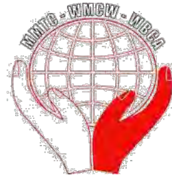
Mouvement mondial des travailleurs chrétiens